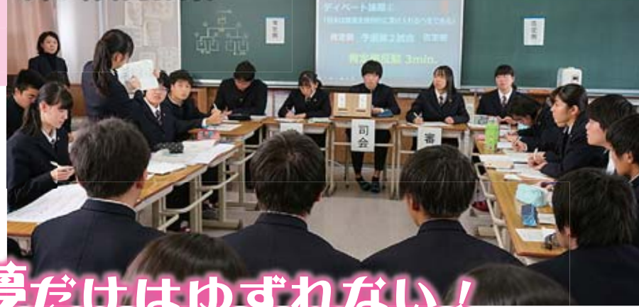
ディベートチャンピオンシップ