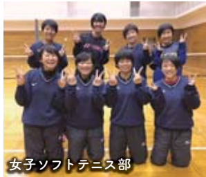
女子ソフトテニス部