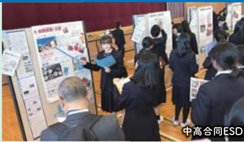
中高合同ESD課題研究発表会