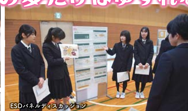
ESDパネルディスカッション