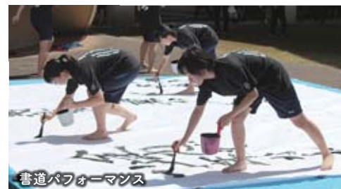
書道パフォーマンス