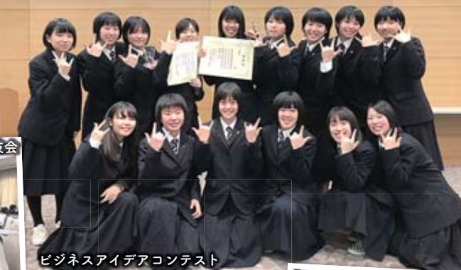
ビジネスアイデアコンテスト