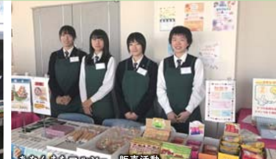
あなんまちマルシェ 販売活動