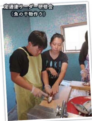
定通連リーダー研修会 (魚の干物作り)

一人一人の個性や能力に応じた指導が行われ、自分の目的や夢に応じた進路が選択できます。