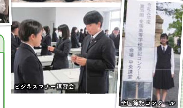
ビジネスマナー講習会