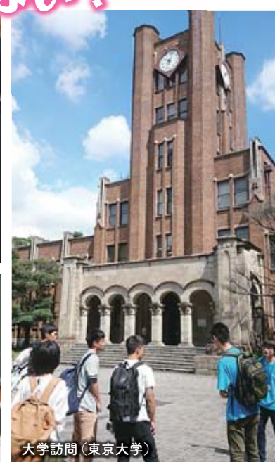
大学訪問(東京大学)