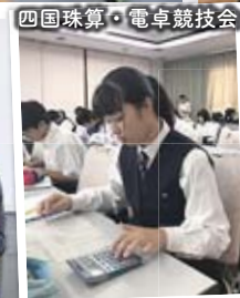
四国球算・電卓競技会