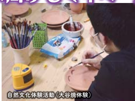
自然文化体験活動(大谷焼体験)