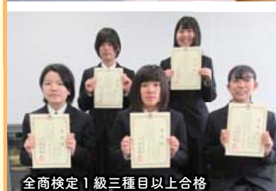
全商検定1級三種目以上合格