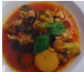
三種の風味野菜たっぷりスープ

家庭科の学習の一環として、夏休みに野菜をたくさん使った料理にチャレンジしました。そのレシピを授業中に共有したところ、栄養を考えたり、盛り付けを工夫したりしていて、とてもおいしそうという声がありました。料理名にも料理の特徴や食欲のわくような工夫があり、一生懸命に取り組んだ様子が伺えました。