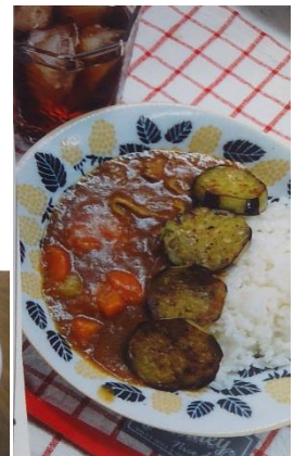
野菜たっぷりカレー