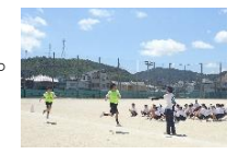
体育祭リレー練習

○今日も書道パフォーマンスの練習をしました。この前よりも上手に書けたと思いますが、もう少し、バランスよく書けるといいです。書き始める所をしっかりと考えて書きたいです。