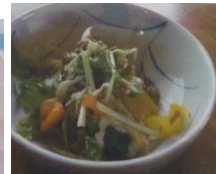
スパイシーサラダ