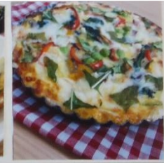
野菜たっぷりキッシュ