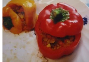
暑さ吹き飛ばすドライカレー in パプリカ