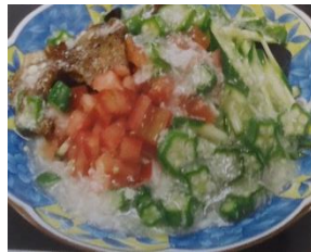
ねがわパワで暑い夏のり切ろうそうめん