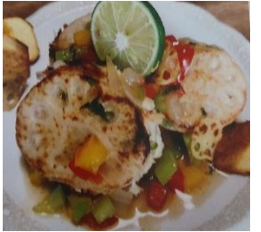
夏香るレンコンのはさみ焼き