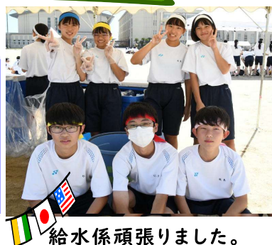
給水係頑張りました。

中学2年生になって応援合戦に出なくてはならなくなりました。普段ダンスを踊ることがないので最初はとても不安でした。先輩に振り付けを教えてもらっても案の定、全く覚えられず踊れませんでした。しかし、朝練に参加したり友達や先輩に優しく教えてもらったりして、なんとか周りの動きについていけるようになった時は、とても嬉しかったです。そして、踊るのが楽しくなりました。本番の10分間はあっという間で、団の仲間と頑張ったことはとてもいい思い出になりました。来年は困っている人がいたら、今年、自分がしてもらったように助けてあげたいと思います。