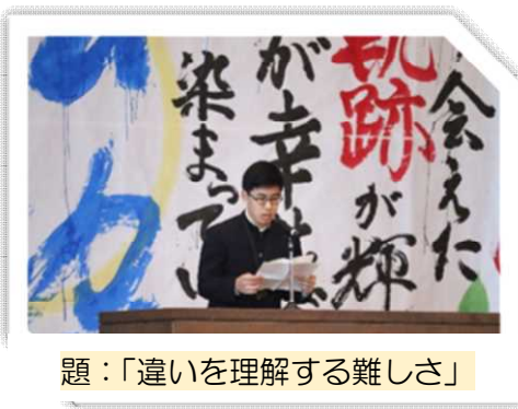
題：「違いを理解する難しさ」