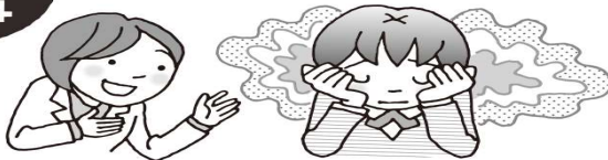
悩みがあるとき…など

○保健室での手当は、応急手当になります。けがをしたときの状況を詳しく教えてください。また、けがの具合によっては、医療機関の受診をお勧めする場合があります。