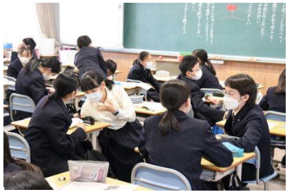
★いっぱい考える道徳科の授業★楽しみながら…でもいつも真剣です