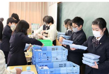
楽しみながら給食! テキパキ準備として黙食を守ります