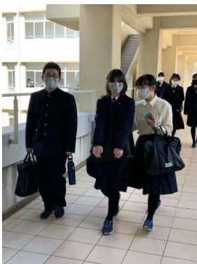
教室移動のひとこま