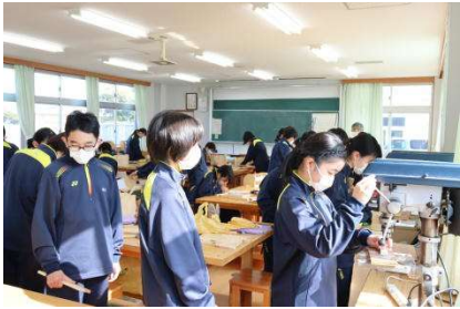
木工工作…間違わないよう先生に確認!