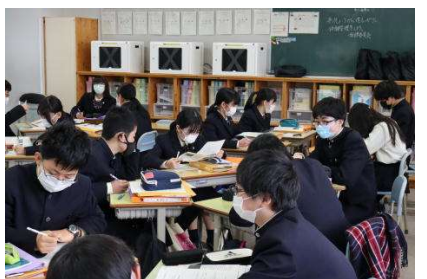
感染対策をしながらのグループ活動…みんなしっかりと意見を言います!