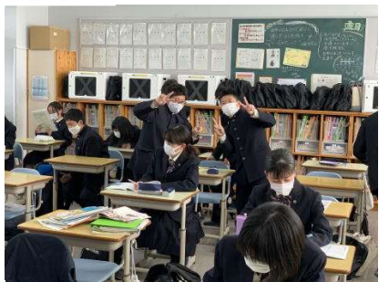
帰りのショートホームルーム前のひととき…帰る準備をしたり、おしゃべりをしたり…