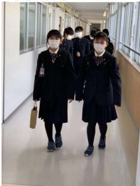
1日終わってほっとした表情です