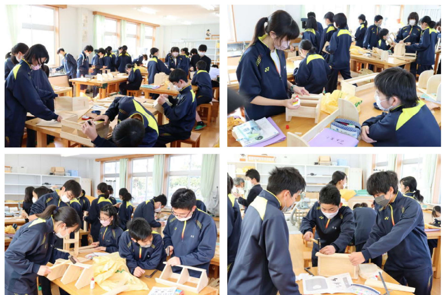
技術での木工工作...うまく出来上がるかな?