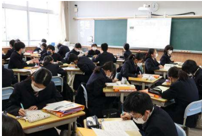
総合的な学習の時間にあわ文化について調べたことを報告!