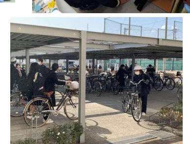
明日も元気に登校しよう!