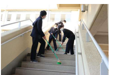
環境・防災委員活動中!