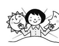
生活習慣を整える