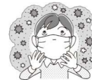
正しくマスク着用