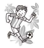
運動、基礎体力アップ