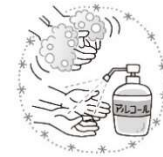
手洗い・手指消毒

変異株が次々に登場している新型コロナウイルス感染症。再び感染が広がってきていて、徳島県でも発生し、徳島アラートも発動されています。この時期はインフルエンザや感染性胃腸炎などその他の感染症も流行しやすい時期です。感染対策に力を入れて、今後も徹底するようにしましょう。