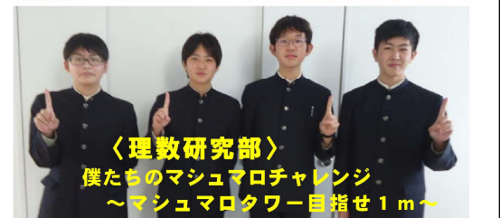
〈理数研究部〉 僕たちのマシュマロチャレンジ ～マシュマロタワー目指せ1m～