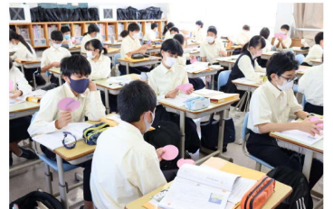
道徳科授業の様子

について考え、誰一人取り残さない社会の実現のために、地域社会の一員として主体的に行動できる「自分」になれるよう、しっかりと人権学習に取り組んでいきましょう。